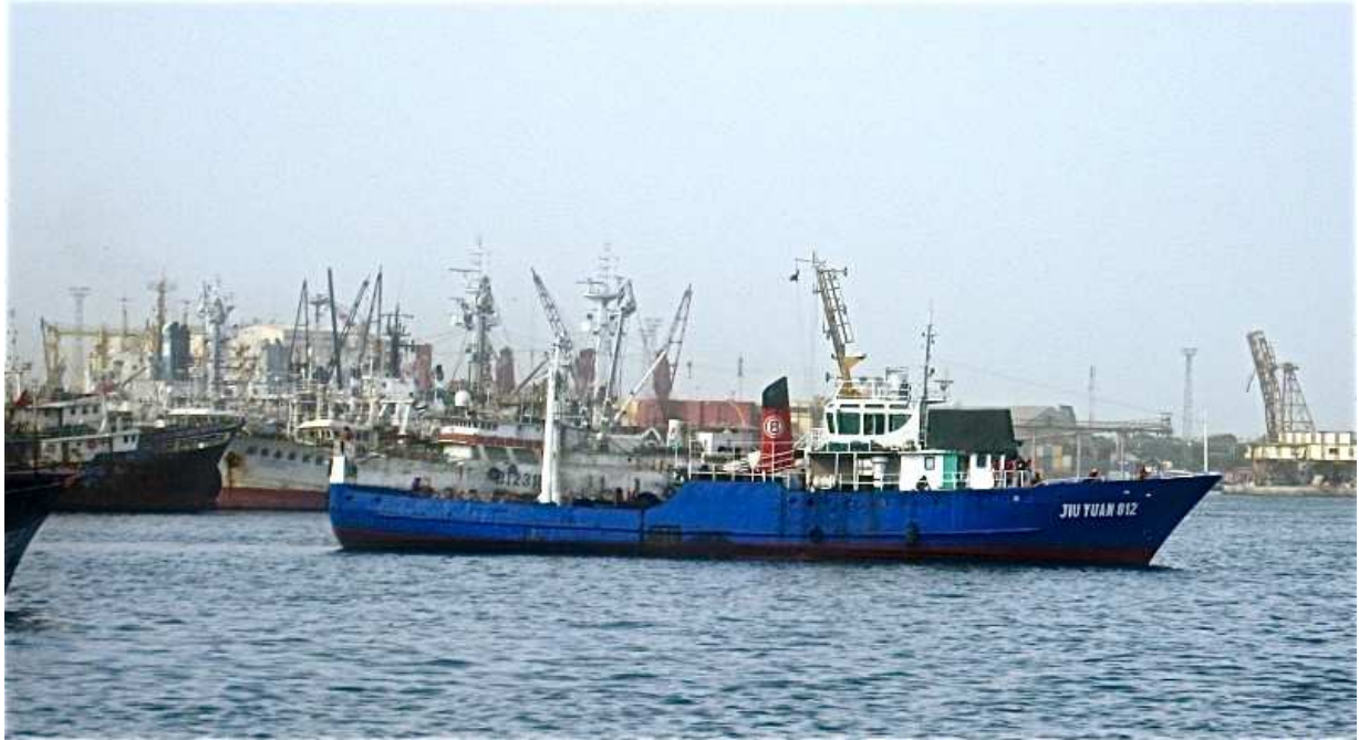
Bateau chinois en sortie au môle 10 du port de Dakar

Les années 1983 et 1999 sont les années où l'on a constaté le plus grand nombre de navires sénégalisés. La mesure du tonnage d'un navire est complexe et peut donner lieu à des erreurs volontaires ou pas. Après quelques contrôles sur place et de nouvelles mesures, une liste de 27 navires considérés comme suspects quant à leur jaugeage a été dressée. Des contrôles sur plan sont au minimum nécessaires. Les jauges de certains navires sont manifestement erronées. La flotte de Sénégal Armement en est une parfaite illustration. Donc ces phénomènes de roublardises étaient connus ou tout au moins le rapport d'audit les a révélés et, jusqu'à présent, pas de sanctions ni de rectifications. Même si le rapport n'était que partiel (audit uniquement des navires détenant des licences pour les espèces démersales côtières) et ne concernait pas la pêche profonde, où des pratiques d'une autre dimension étaient en cours : fraude sur les options, utilisation de chaussettes pour la capture de crevettes, rejets massifs de poissons, etc., ces conclusions pouvaient faire l'objet d'une attention et d'une prise en charge par les autorités pour au moins donner des gages aux futurs plans d'aménagement des pêcheries.