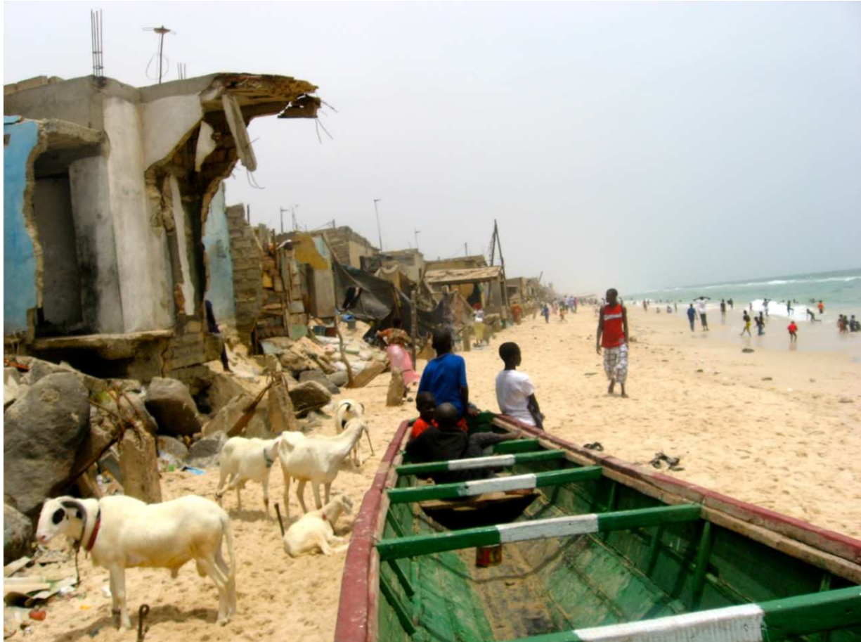
Le quartier et le quai de pêche de Guet N'dar, victime de l'érosion

ambiante dans la société sénégalaise où plus de 40% des ménages ont des difficultés de survie. Les changements climatiques ont fait leurs effets sur la bande côtière avec l'impact sur l'érosion maritime, la pollution, la dégradation des habitats des poissons et des zones de reproduction, les spéculations foncières dans les différentes localités des pêcheurs au profit du tourisme, de l'industrie extractive de sable et de zircon, et de l'immobilier.